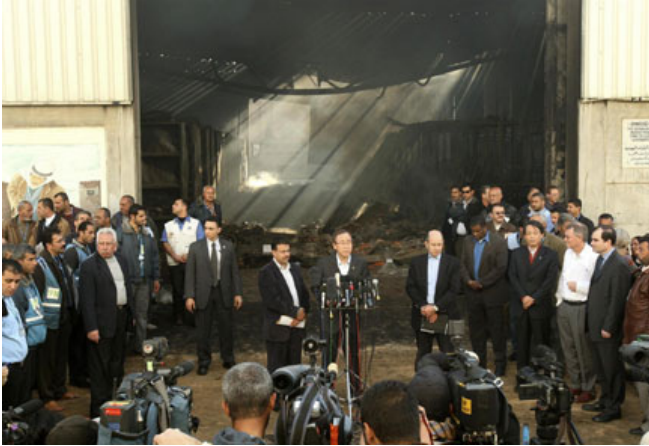
الأمين العام للأمم المتحدة بان كي مون يتحدث إلى الصحفيين في مدينة غزة أمام مقر الأمم المتحدة الذي تعرض لنيران اسرئيلية خلال الهجوم الاسرائيلي، 20 يناير 2009، | تصوير: رويترز صهيب سالم

نشرة الأخبار الإنسانية هي نشرة شهرية يصدرها المكتب الإقليمي للأمم المتحدة لتنسيق الشؤون الإنسانية (أوتشا) في دبي، وتقدم النشرة تقارير عن الأحداث الإنسانية الرئيسية في منطقة الشرق الأوسط، شمال أفريقيا، ووسط آسيا. لمزيد من المعلومات عن العراق أو الأراضي الفلسطينية المحتلة، يرجى زيارة www.ochairaq.org و www.ochaopt.org .