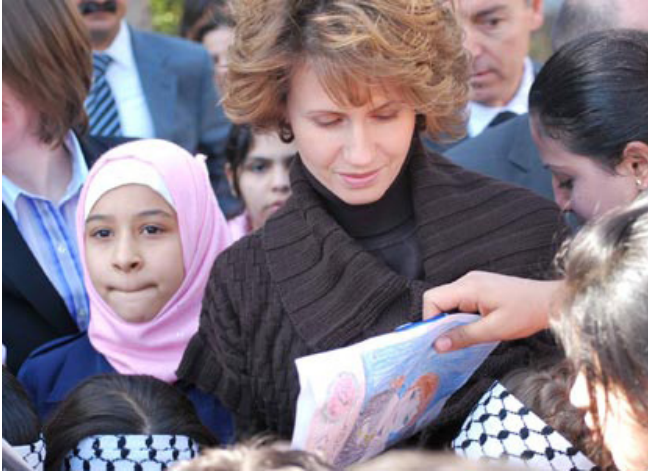
طلاب مع السيدة الأولى في سورية أسماء الأخرس الأسد | الصورة: باول كرزنيك.

ودعمت السيدة الأولى في سوريا أسماء الأسد رسمياً الأونروا في حملتها "من أجل أطفال غزة" التي أطلقت في 12 يناير كانون الثاني بالتعاون مع عدد من الشركاء من القطاع العام، الخاص والمجتمع المدني. وتهدف الحملة لجمع الأموال لدعم أطفال غزة وزيادة الوعي بين أطفال سوريا بخصوص العنف والخسائر غير المبررة في الأرواح.