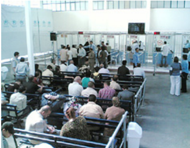
لاجن عراقي في مركز تسجيل تابع للمفوضية العليا في دمشق

تستمر المفوضية السامية لشؤون اللاجئين في القيام بأنشطتها دعماً للاجئين العراقيين في سوريا. ولكن التمويل المتفق عليه لعام ٢٠٠٩ هو تقريباً نصف الميزانية التشغيلية لعام ٢٠٠٨ واضطرت المفوضية السامية لشؤون اللاجئين إلى إرجاء العديد من الأنشطة إلى حين تحسن التمويل خلال السنة.